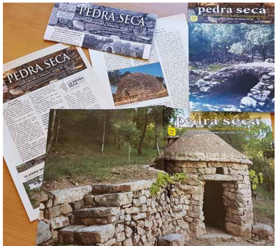
Figura 8 | Exemplers de la revista Pedra Seca i del Full Informatiu de la Pedra Seca.

Ha estat un dels motors, des de la seva reconeguda modèstia de mitjans, de l'interès que vivim avui dia per la pedra seca