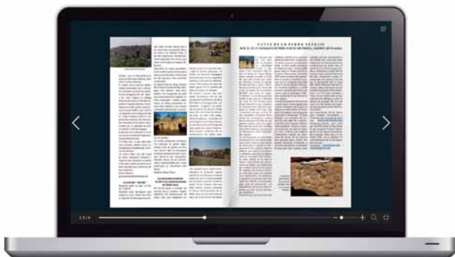
Figura 9 | Visualització digital del Full Informatiu de la Pedra Seca .

Pel que fa a la pervivència del projecte, convindria augmentar la llista de socis i subscriptors, alguna subvenció, ja que al capdavall estem fent una part de la feina per l'interès comú, i que se simplifiqués la gestió administrativa de les entitats sense ànim de lucre petites. Nosaltres no movem diners, però hem de presentar comptes com si fóssim una empresa. Això ens complica moltíssim el dia a dia i augmenta innecessàriament les nostres despeses.